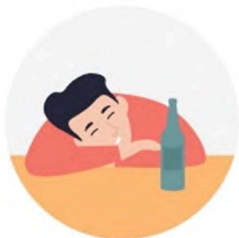
ВЫПИВКА В ОДИНОЧКУ