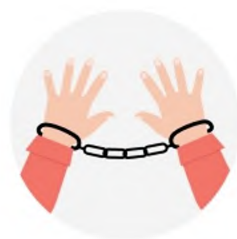
ПРОБЛЕМЫ С ЗАКОНОМ И НА РАБОТЕ