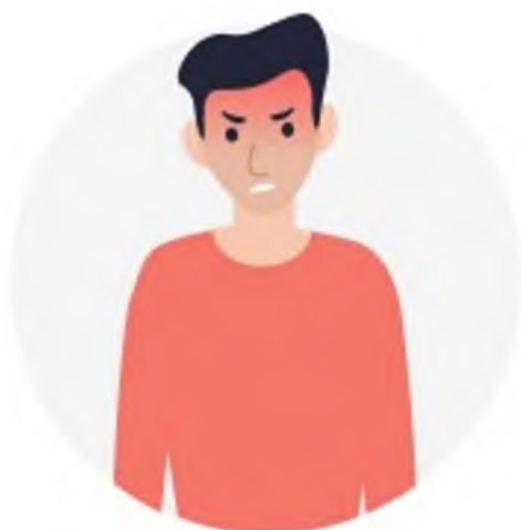
АГРЕССИЯ ПО ОТНОШЕНИЮ К БЛИЗКИМ