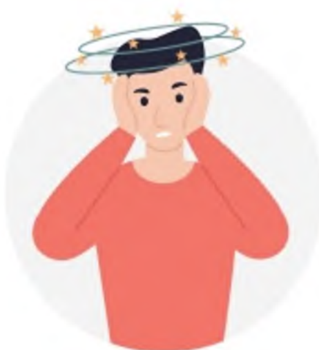
ПРОВАЛЫ В ПАМЯТИ