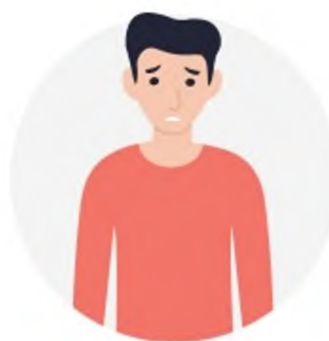
ПОТЕРЯ ИНТЕРЕСА К ЛЮБИМЫМ ЗАНЯТИЯМ