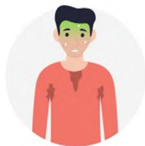
ПРОБЛЕМЫ СО ЗДОРОВЬЕМ