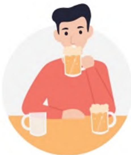
ОТСУТСТВИЕ КОНТРОЛЯ КОЛИЧЕСТВА ВЫПИТОГО